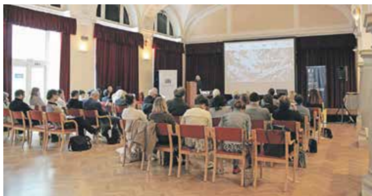
Udeleženci posveta so o različnih temah razpravljali na več omizjih.