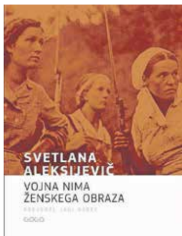
Svetlana Aleksijevič je za svoje delo leta 2015 prejela Nobelovo nagrado za književnost.

lastnega nabora čustev, imajo tudi sebi lasten jezik, ritem in zamolke. V njih se »ves čas preigravajo tudi (samo)cenzura, boleča nezmožnost govoriti in hkrati nuja pripovedovati. Po Riceurju vemo: vsak dogodek se zgodi dvakrat, prvič, ko ga doživimo, in drugič, ko o njem pripovedujemo. Pripovedovanje kot oblika razmišljanja ostaja eno od naših najboljših orodij za razumevanje in osmišljanje lastnih izkušenj«. Toda pripovedovanje je tudi družbeno dejanje, je poudarila avtorica, »je zavestno seganje k drugemu in s tem na intimni ravni način rahljanja samote. Še posebej pri upovedovanju travmatične izkušnje človek potrebuje pričo.«